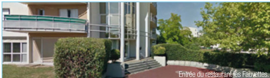
Entrée du restaurant les Fauvettes.

Une personne ne peut réserver que 2 places à la fois. Pour les repas pris à la résidence des Fauvettes : merci de vous inscrire auprès de ce service muni de votre dernier avis d'imposition pour définir le coût du repas, 72 heures avant au minimum.