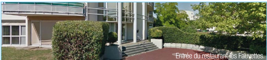
Entrée du restaurant Les Fauvettes.

Pour les repas pris à la résidence des Fauvettes : merci de vous inscrire auprès de ce service muni de votre dernier avis d'imposition pour définir le coût du repas, 72 heures avant au minimum.