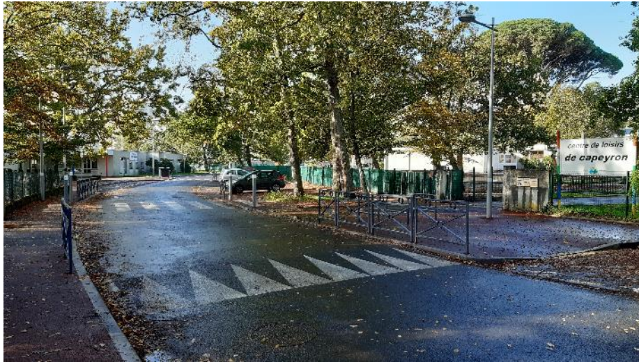
Rue Jean Giono