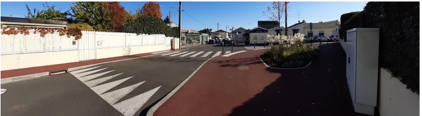
Carrefour Doumer / Hourquet / Barrière

D'autres travaux d'amélioration de la voirie sont à venir rue Château Thierry et rue de l'Industrie. En 2020, une intervention sur le réseau d'assainissement de la rue Charlin est prévue. Avenue de la Marne, le chantier de l'îlot 2B (à côté du foyer Gisèle de Faily) ne permet pas de conserver la totalité du stationnement longitudinal, qui sera neutralisé temporairement. Ce chantier vient de démarrer et durera 14 mois.