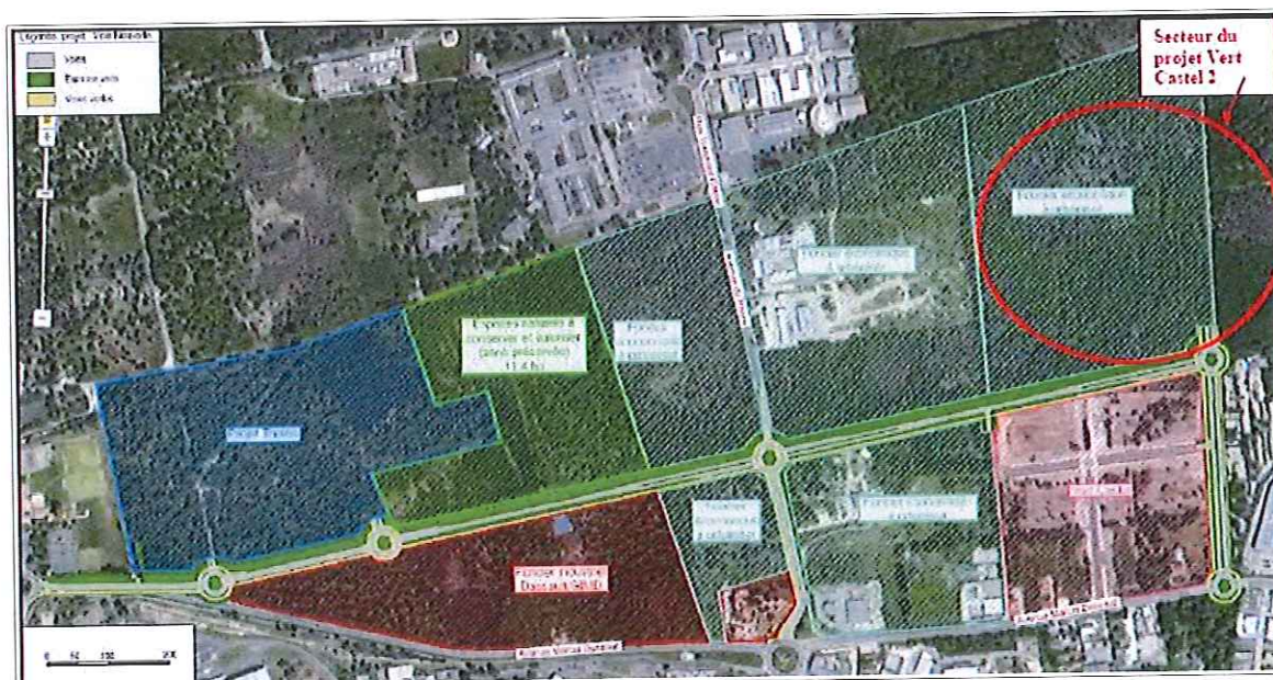
Projet de développement du secteur – Extrait de l'étude d'impact

Le projet s'implante dans un secteur en fort développement, comme illustré sur la cartographie ci-après.